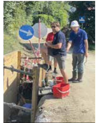
Behebung von Wasserrohrbrüchen am Bundweg

Das Team der Wassergenossenschaft Hönigtal wird noch in diesem Jahr aufgestockt. Eine Mitarbeiterin bzw. ein Mitarbeiter für unterschiedliche Büroarbeiten und administrative Tätigkeiten wird auf Basis geringfügiger Beschäftigung gesucht. Interessierte Personen melden sich bitte unter 0664/4019957.