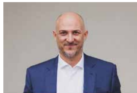
RA Mag. David Spahija CORTOLEZIS Rechtsanwälte

Der Makler hat darüber hinaus auch dann keinen Provisionsanspruch gegenüber dem Mieter, wenn der Vermieter und das Maklerunternehmen als wirtschaftlich verbundene Unternehmen gelten oder der Vermieter Einfluss auf den Makler ausüben kann. Um Umgehungen zu verhindern, soll der Woh-