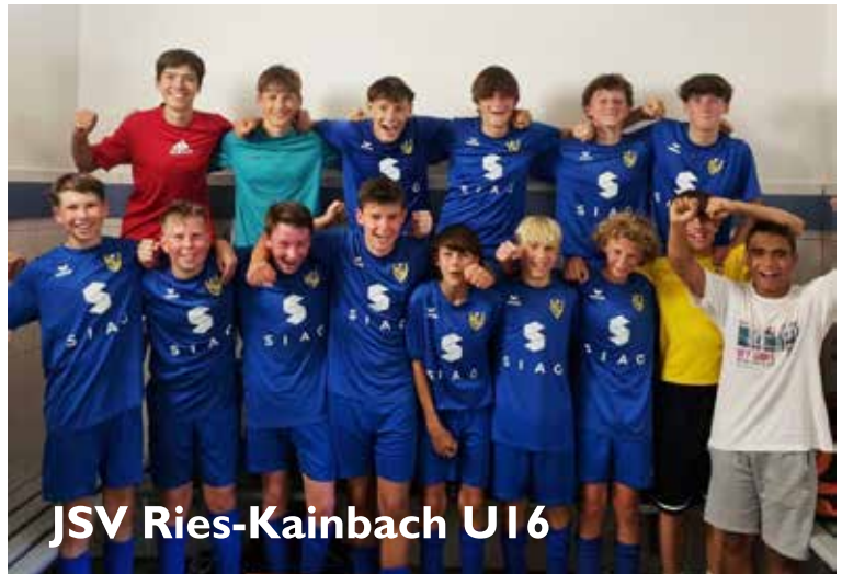
JSV Ries-Kainbach U16

Informationen über das HERBSTFERIEN-CAMP auf Seite 14!