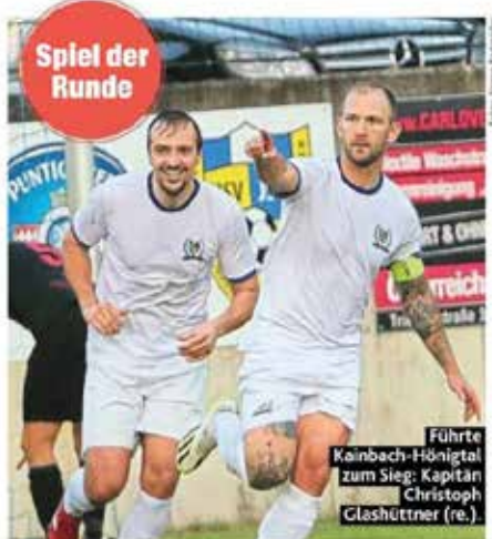
Spiel der Runde