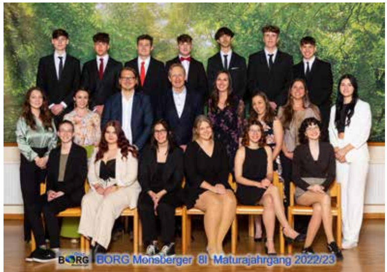
BORG BORG Monsberger 8Li Maturajahrgang 2022/23